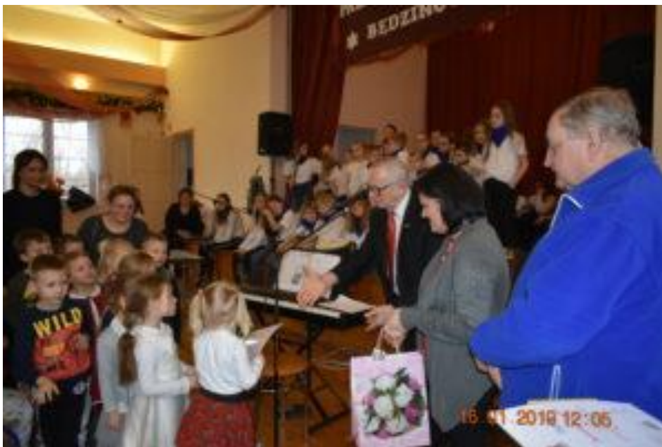
GMINNE OBCHODY DNIA BABCI I DZIADKA