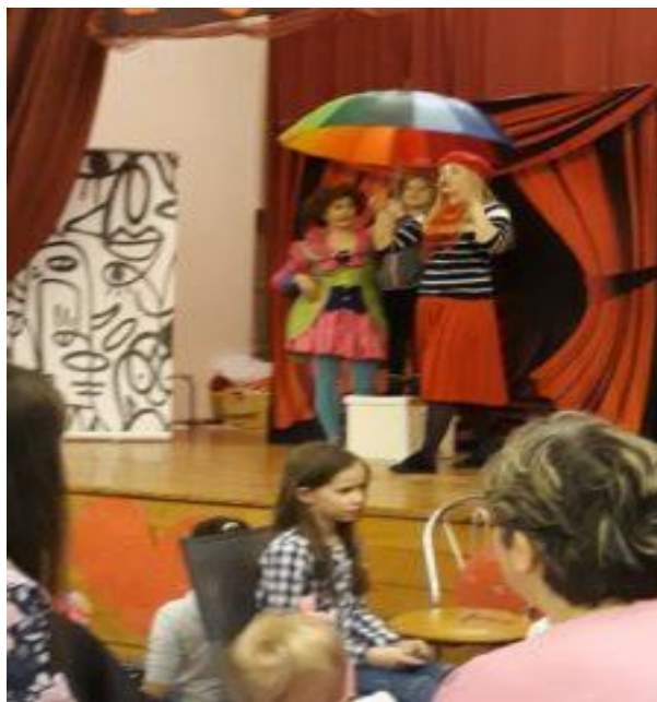
GMINNY PRZEGLĄD JASELEK.