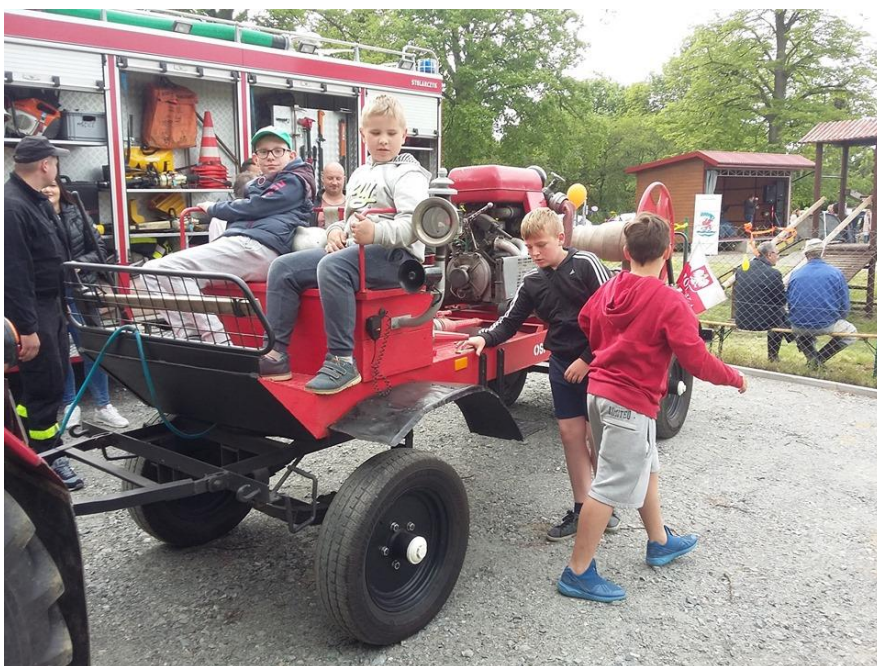
GMINNY DZIEŃ DZIECKA 2019 W DOBRZYCY