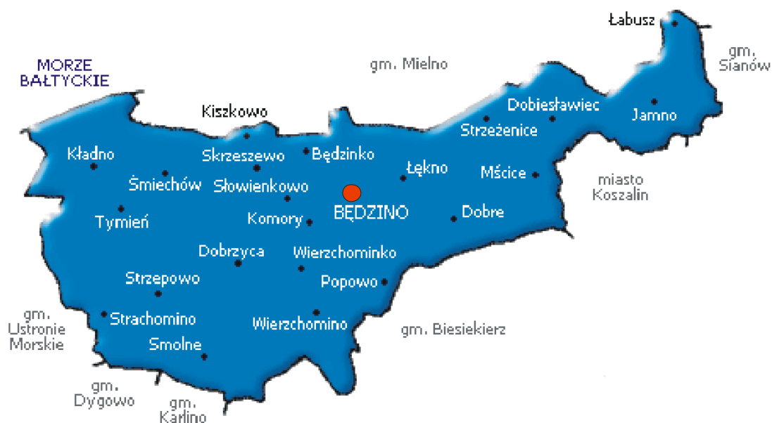
Rysunek 1 Położenie miejscowości Będzino

Najbliższa okolica miejscowości jest obszarem lekko pofałdowanym, bezleśnym, bez wyraźnych elementów hydrograficznych – przez Będzino przepływa bowiem jedynie niewielki, bezimienny strumień.